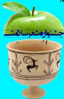
جشنواره شعر سلامت

بر اساس رای هیات داوران به نفرات اول تا هفتم تندیس جشنواره + لوح افتخار + جایزه نفیس اهدا خواهد شد.